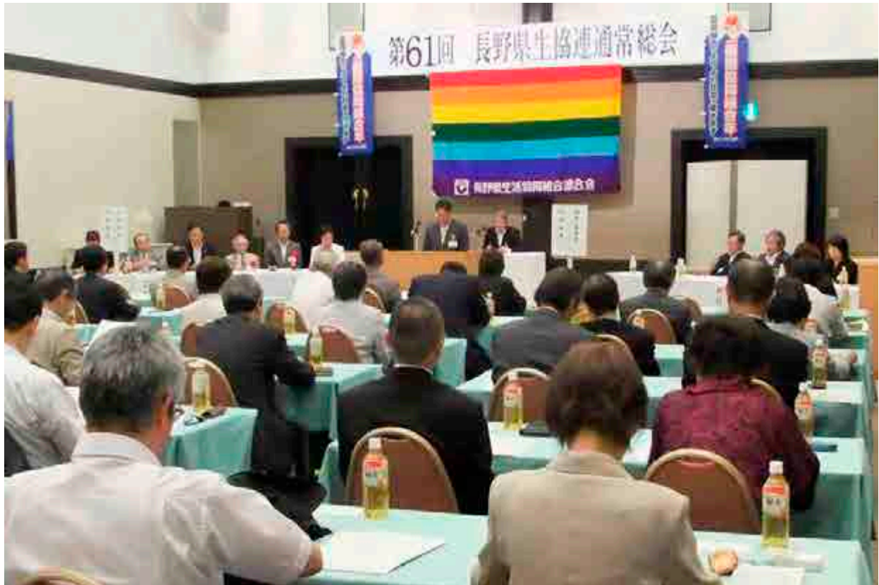
6月5日(火)第61回通常総会をマリパルクNAGANO(長野市)で開催し、提案された議案すべてが可決承認されました。