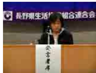
石川代議員の報告