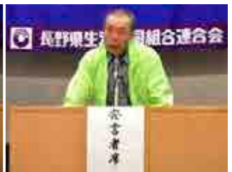
片桐代議員の報告