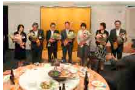
退任役員花束贈呈